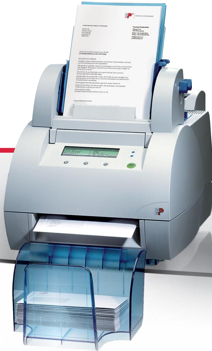
Tischkuvertiersystem FPI 500

Falzen, Kuvertieren, Schließen – 10x schneller als manuell.