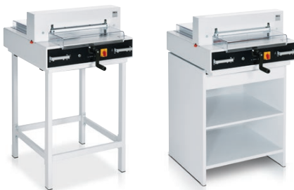
Untergestell optional Unterschrank optional