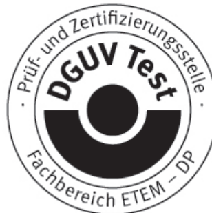
Unterschrift (Dipl.-Ing. Vogl)

Diese Bescheinigung einschließlich der Berechtigung zur Anbringung des GS-Zeichens ist gültig bis: 21.03.2015